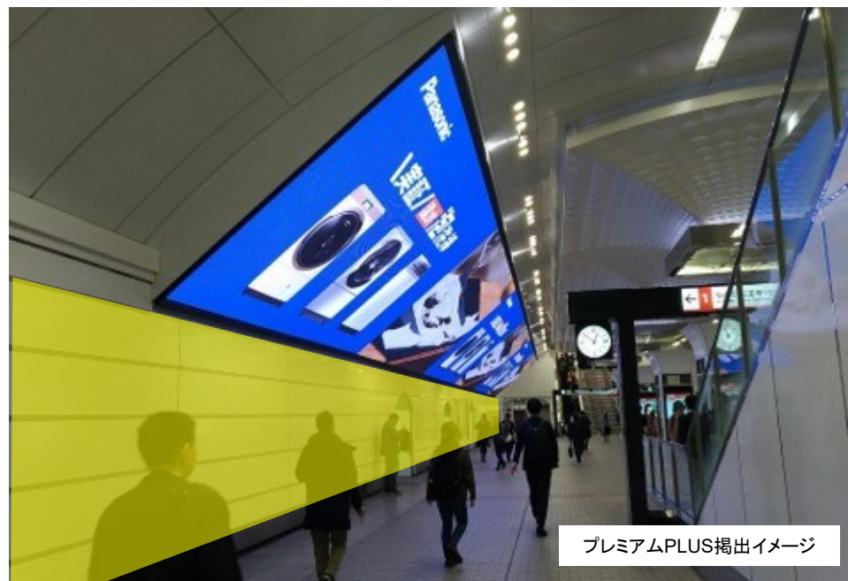
プレミアムPLUS掲出イメージ